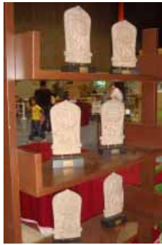
ช่างที่ระลึก