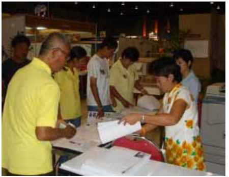
แจกแบบบ้านด้วยรักและผูกพัน