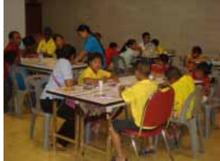
สถาปนิกน้อย