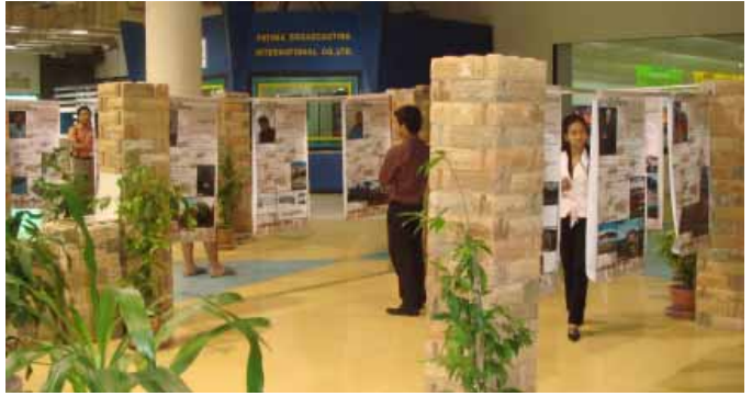
Architects Profile สถาปนิกภูมิภาคอีสาน