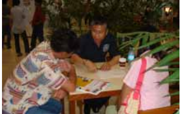
หมอบ้านอาษา