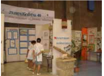
นิทรรศการสถาบันการศึกษา