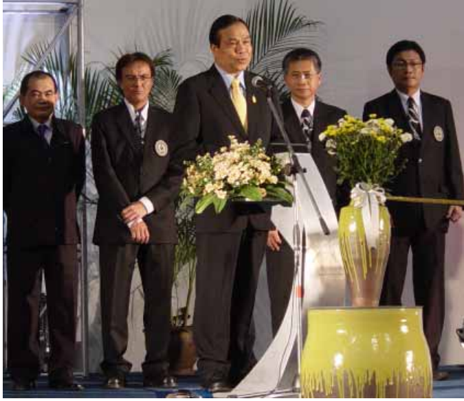
ผู้ว่าราชการจังหวัดนครราชสีมา ประธานในพิธีกล่าวเปิดงาน